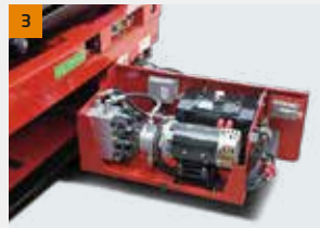
Sistema hidráulico e elétrico