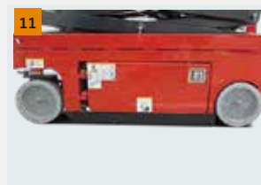
Sistema anti-capotamento: Quando a máquina subir mais de 2m, este sistema funcionará automaticamente, para proteger a máquina de capotamento enquanto circular em terreno desnivelado