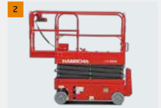
Deck de extensão