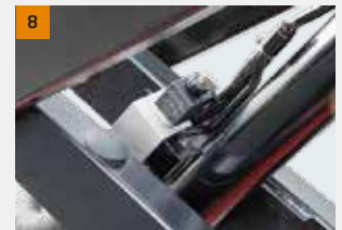
Válvula à prova de vazamento: Para evitar que a máquina caia quando o tubo de óleo estiver vazando