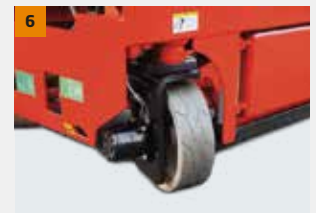
Motor de tração