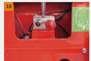
Válvula de liberação manual: Quando a máquina não puder se mover, você pode empurrar a máquina depois de pressionar esta válvula