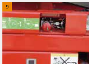
Válvula de abaixamento manual: Quando o sistema de operação falhar ou a energia da bateria estiver muito baixa para permitir que a plataforma desça, podemos usar esta válvula para abaixar a máquina