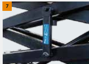
Braços de apoio: Para proteger o operador quando ele estiver fazendo trabalhos de reparo ou manutenção